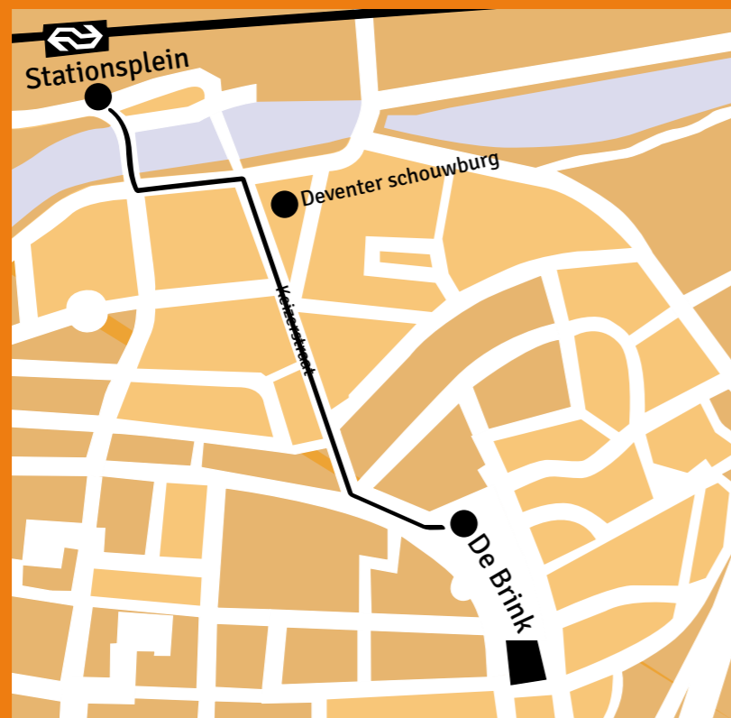
looproute (vannaf het station) naar de Brink te Deventer.